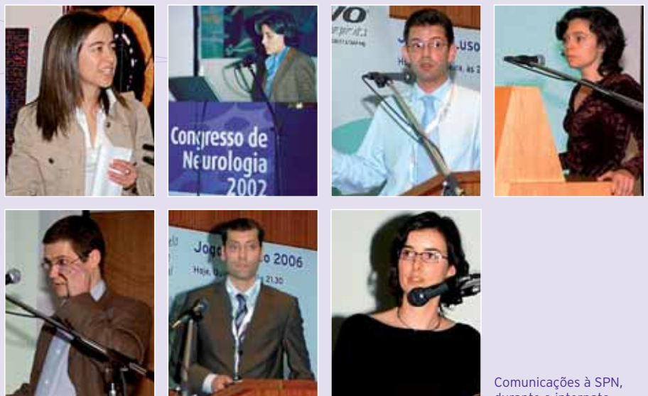
Comunicações à SPN, durante o internato.