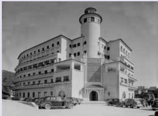
Grande Hotel do Luso

Regulamento em: www.spneurologia.org | Informações: spn.sec@spneurologia.org