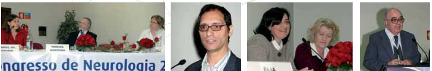
Sociedade Portuguesa de Cefaleias